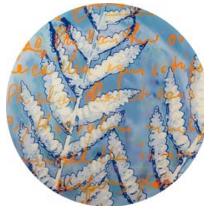
Título: Osmunda cinnamomea Autor: Stübing Año: 2015 Dimensiones: 100 cm diámetro Técnica: Mixta sobre metacrilato y tabla