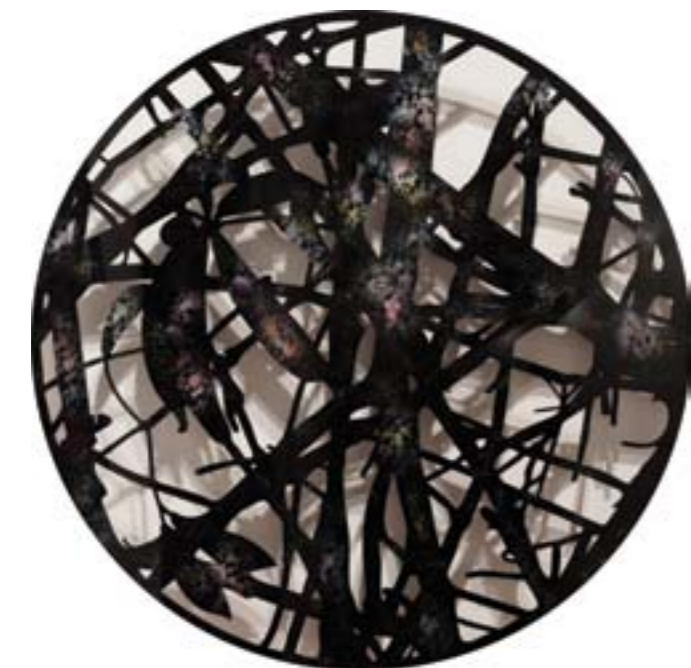
Título: Getrimmte Naked Scheibe nº 5 Autor: Stübing Año: 2015 Dimensiones: 100 cm diámetro Técnica: Técnica Mixta sobre metacrilato calado.