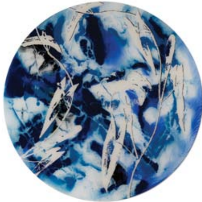
Título: Ipomoea sagittata. Tab. 107 Autor: Stübing Año: 2015 Dimensiones: 145 cm diámetro Técnica: Mixta sobre metacrilato