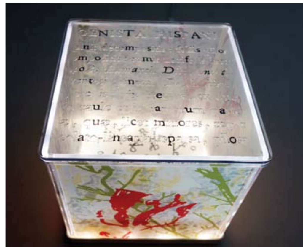
Título: Genista hispanica Autor : Stübing Año: 2015 Medidas: 24 x 24 x 24 cm Miniinstalación: ABS, metacrilato, acrílico e iluminación led