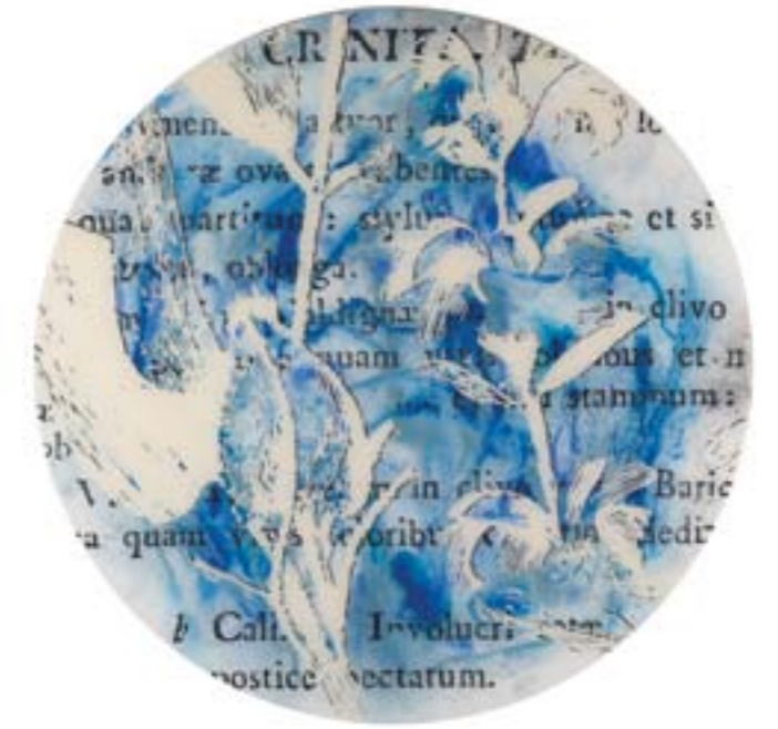
Título: Phlomis crimita. Tab. 247 Autor: Stübing Año: 2015 Dimensiones: 100 cm diámetro Técnica: Mixta sobre metacrilato