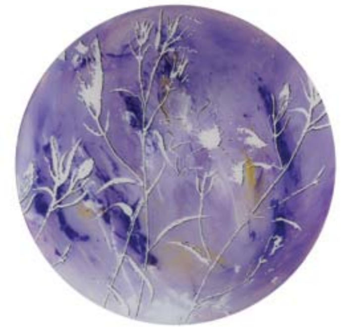
Título: Convolvulus valentinus . Tab. 180. Fig. 2 Autor: Stübing Año: 2015 Dimensiones: 100 cm diámetro Técnica: Mixta sobre metacrilato