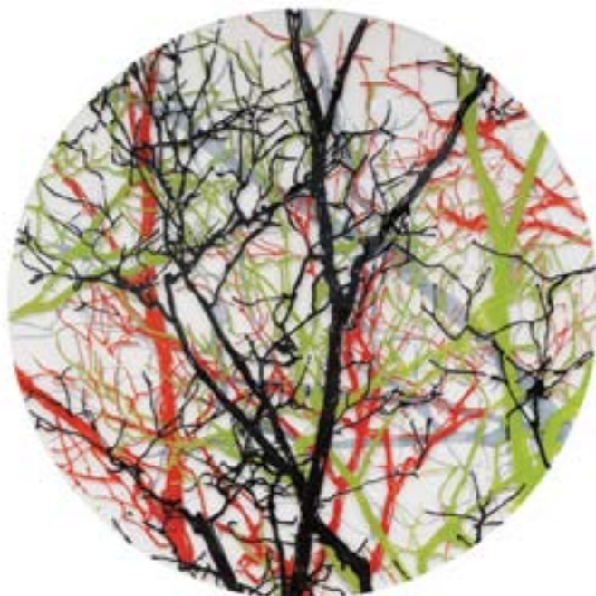
Título: Naked Scheibe 9 Autor: Stübing Año: 2015 Dimensiones: 100 cm diámetro Técnica: Mixta sobre metacrilato y tabla