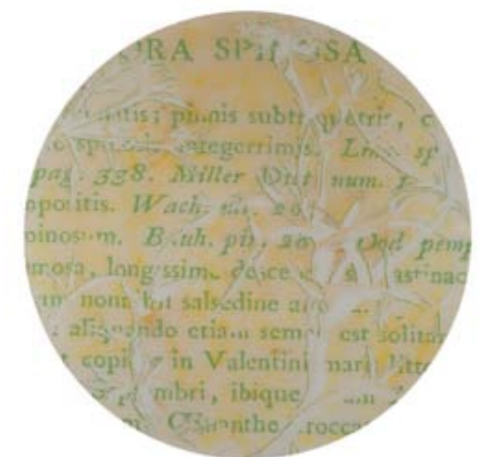
Título: Echinophora spinosa Linnaei. Tab. 127 Año: 2015 Dimensiones: 145 cm diámetro Técnica: Mixta sobre metacrilato