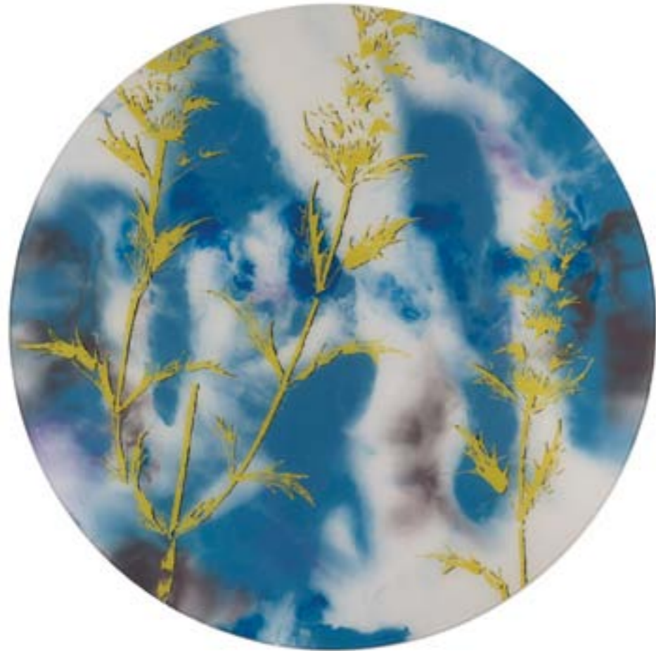
Título: Sideritis subspinosa. Tab. 209 Autor: Stübing Año: 2015 Dimensiones: 100 cm diámetro Técnica: Mixta sobre metacrilato y tabla