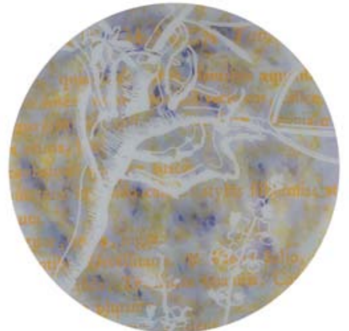
Título: Sideritis glauca Tab. 185 Autor: Stübing Año: 2015 Dimensiones: 145 cm diámetro Técnica: Mixta sobre metacrilato y tabla