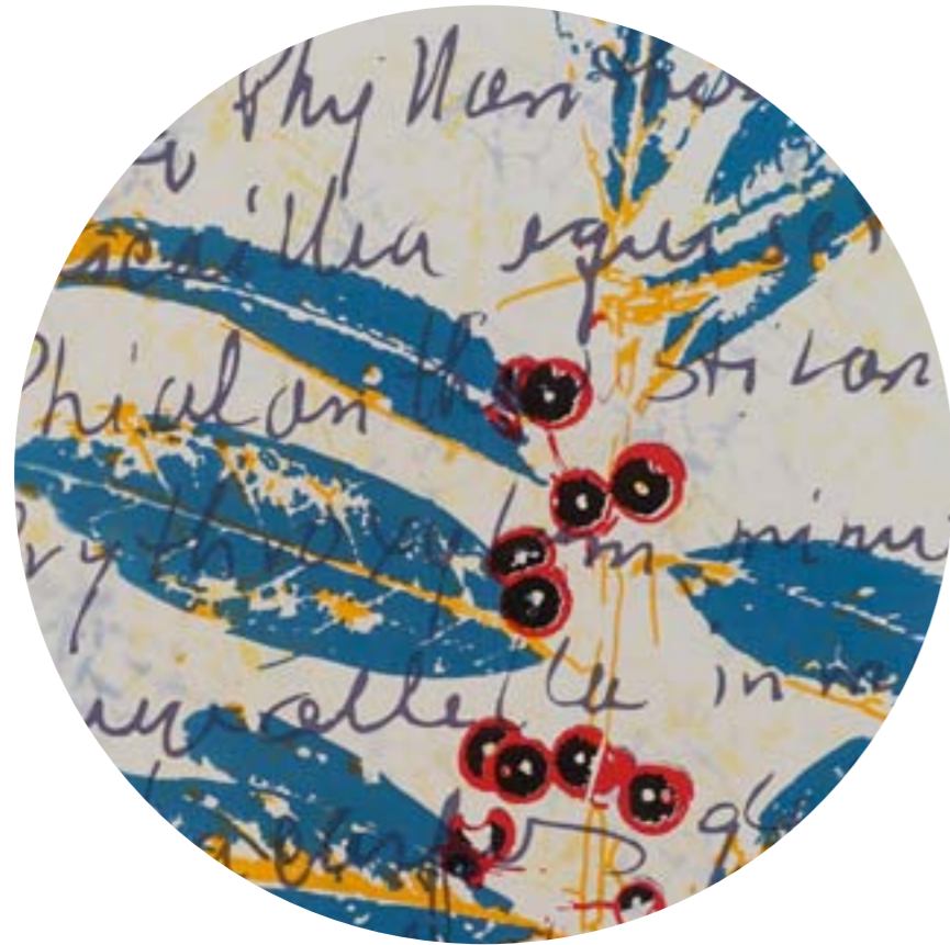
Título: Ilex cassine (detalle) Autor : Stübing Año: 2015 Medidas: 76 x 57 cm Técnica: Serigrafía intervenida y gofrado sobre papel Arches 88 de 300 g Serie "Flora Cubensis"