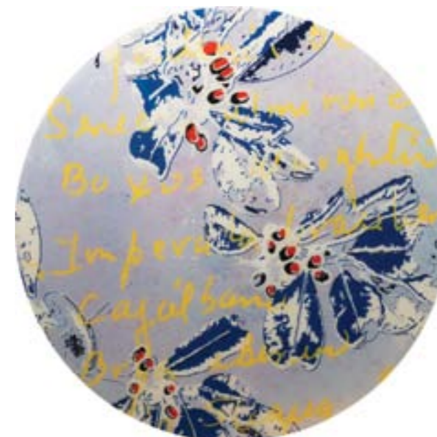
Título: Erythroxyton confusum Autor: Stübing Año: 2015 Dimensiones: 145 cm diámetro Técnica: Mixta sobre metacrilato y tabla