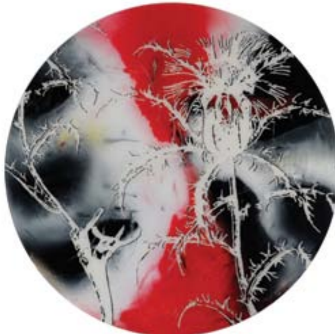
Título: Atractylis humilis Linn. Tab. 54 Autor: Stübing Año: 2015 Dimensiones: 145 cm diámetro Técnica: Mixta sobre metacrilato