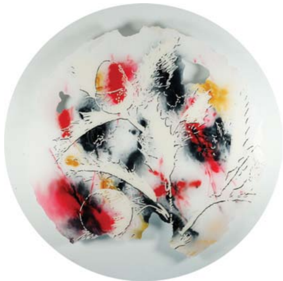
Título: Quercus valentina Tab. 129 Autor: Stübing Año: 2015 Dimensiones: 100 cm diámetro Técnica: Mixta sobre metacrilato perforado