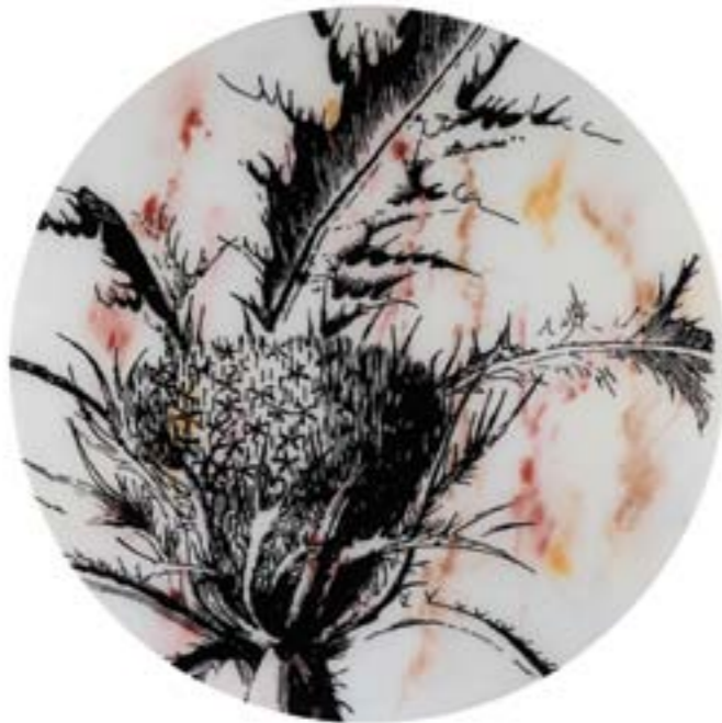
Título: Atractylis gummifera Linnaei. Tab. 228 Autor: Stübing Año: 2015 Dimensiones: 100 cm diámetro Técnica: Mixta sobre metacrilato