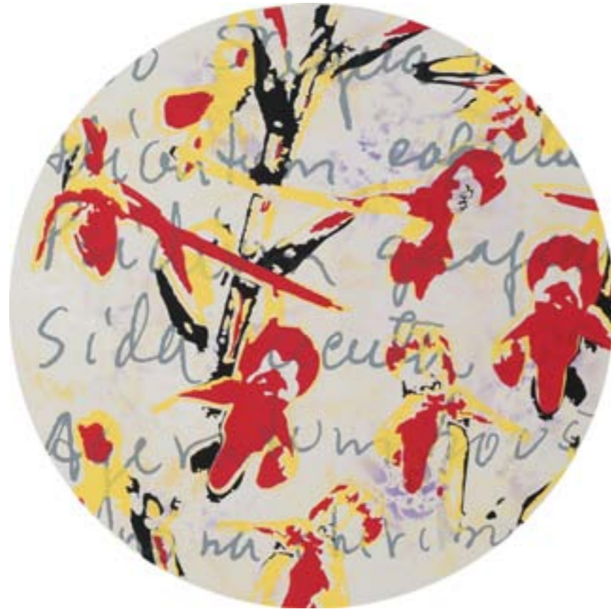
Título: Habenaria quinqueseta (detalle) Autor : Stübing Año: 2015 Medidas: 76 x 57 cm Técnica: Serigrafía intervenida y gofrado sobre papel Arches 88 de 300 g Serie "Flora Cubensis"