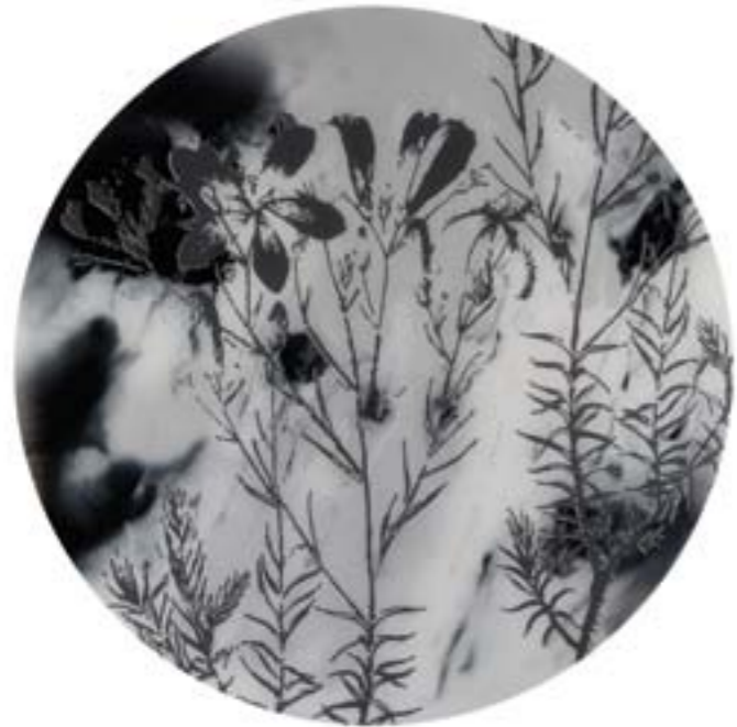
Título: Linum suffruticosum Linnaei. Tab. 108 Autor: Stübing Año: 2015 Dimensiones: 145 cm diámetro Técnica: Mixta sobre metacrilato